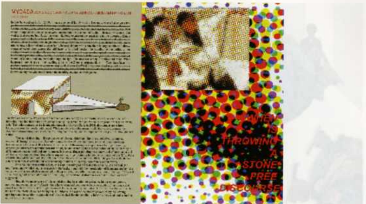
Proposal for Projectory, 2008 Pitching machine, ramp, netting, ball